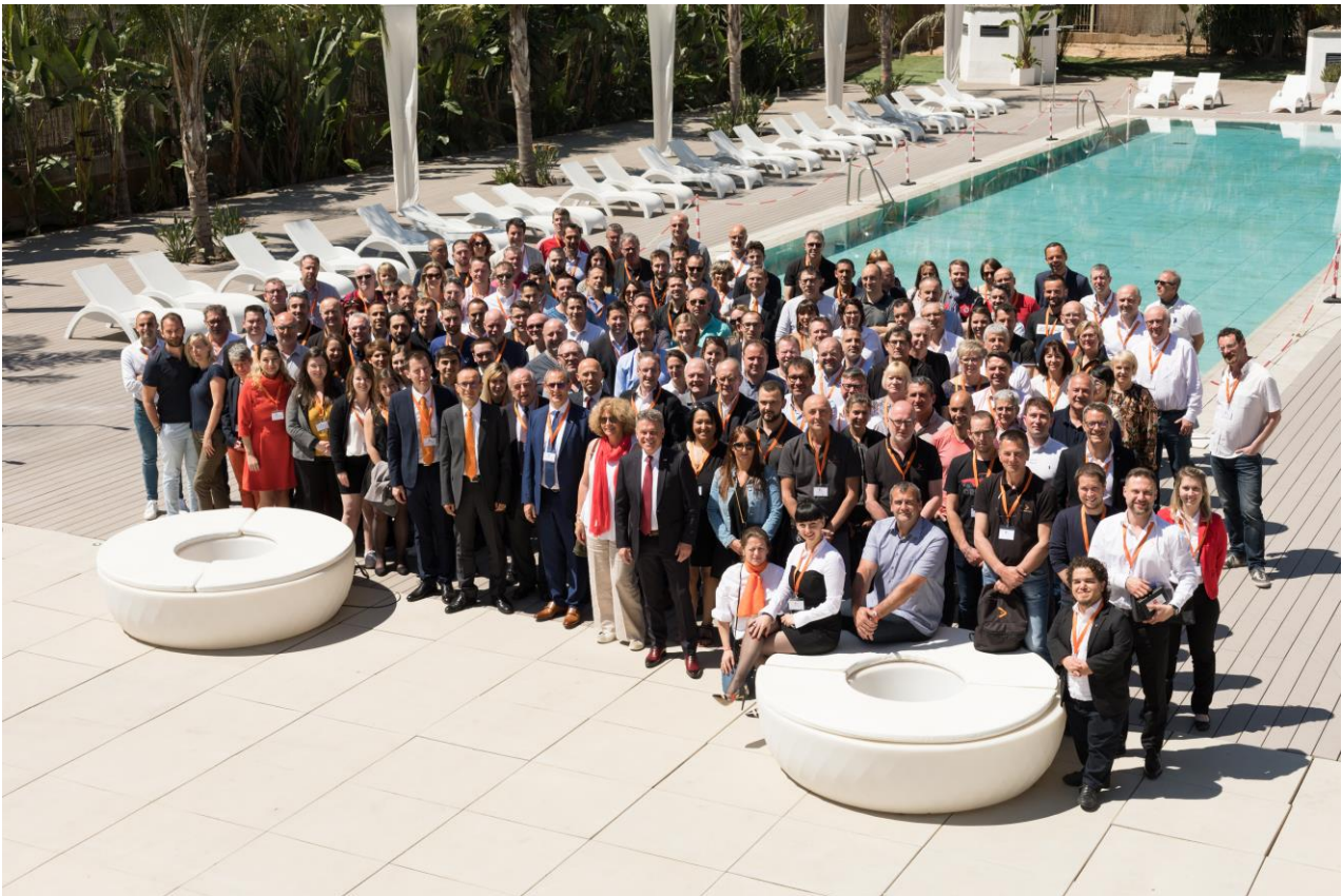
13 Avril 2019